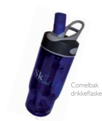
Comelbak drikkeflaske kr. 125,-