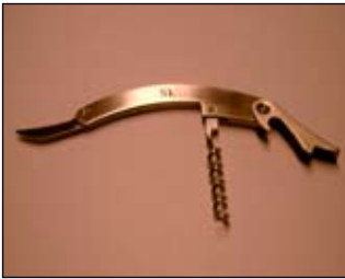
SkLs vinopptrekker kr 25,-