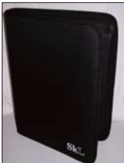
SkLs dokumentmappe kr 150,-