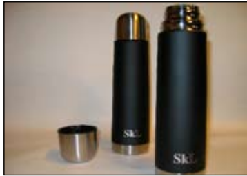
SkLs termos kr.75,-