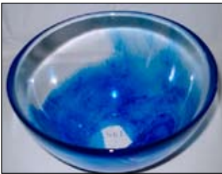
SkLs store bolle kr 320,-