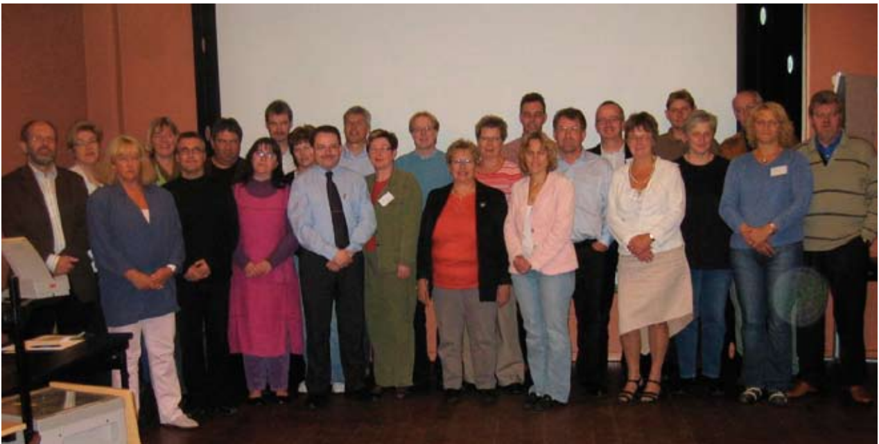
Deltakere på NSO møtet i Bergen.

SkL var vertskap for årets NSO møte, og vi kunne tilby våre nordiske gjester en festspillby i strålende solskinn. Erfaringsutveksling viser at vi har mye felles, og et felles fokus på å bevare arbeidsplasser innen etatene er høyt prioritert.