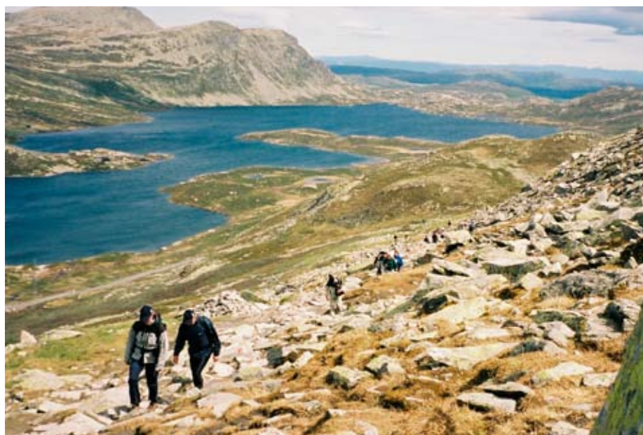
Sentralstyret på vei mot Gaustadtoppen.