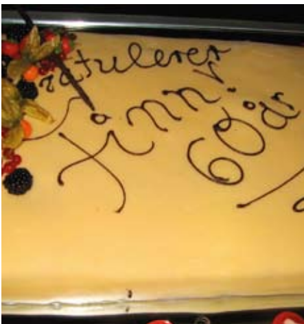
Ingen fest uten kake.