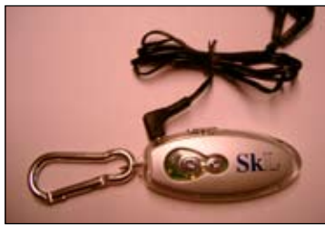
SkLs miniradio kr 60,-