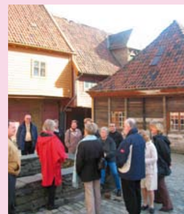
Fra Bryggen, guidet byvandring i Bergen.