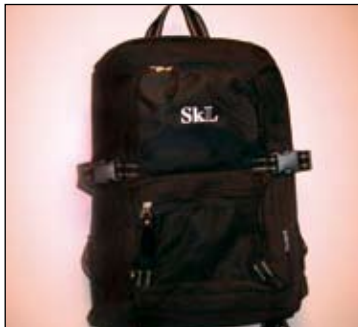
SkLs ryggsekk kr 150,-

I tillegg har vi bra lager av følgende artikler: